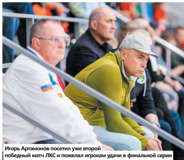
Игорь Артамонов посетил уже второй победный матч ЛКС и пожелал игрокам удачи в финальной серии