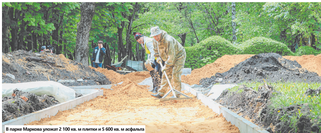
В парке Маркова уложат 2 100 кв. м плитки и 5 600 кв. м асфальта