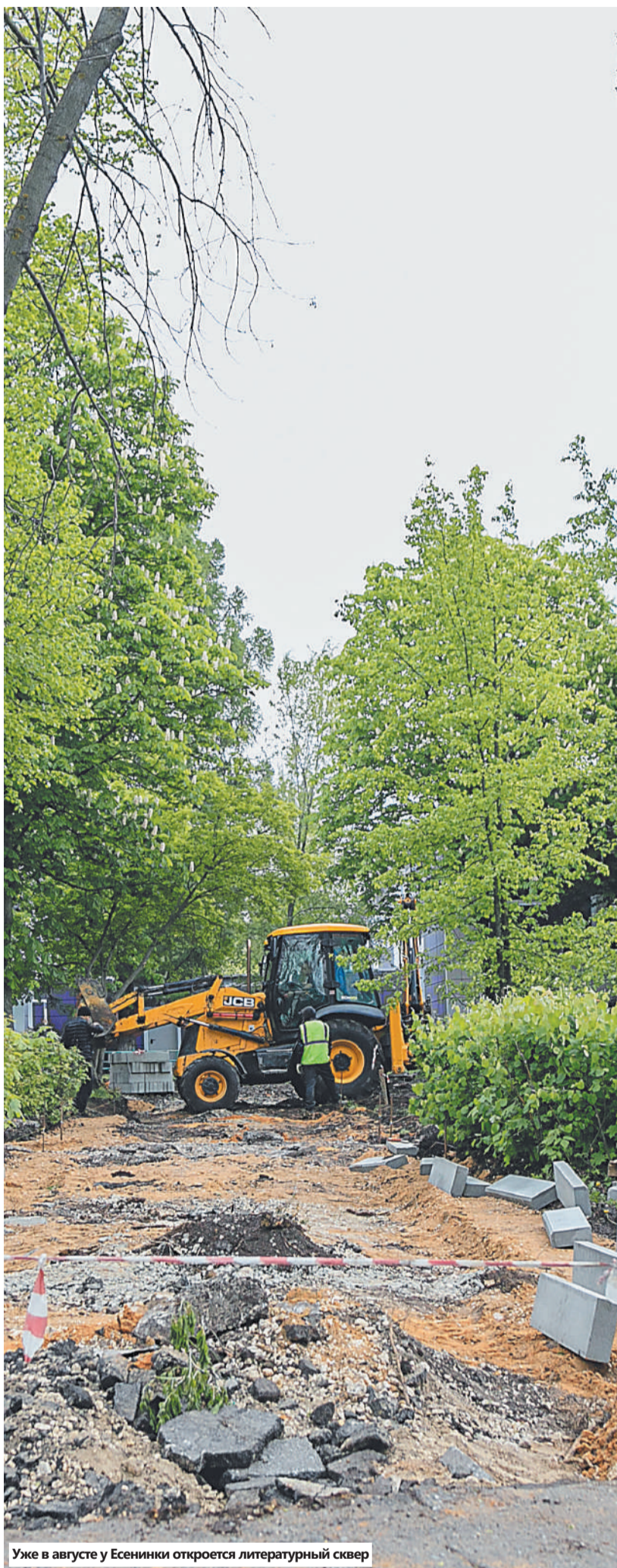
Уже в августе у Есенинки откроется литературный сквер

— В 2023 году в приоритетный список войдут 16 территорий. Именно они будут благоустроены в первую очередь, — прокомментировали в департаменте градостроительства и архитектуры Липецка. — Предварительно на эти цели выделили 172 млн рублей. Но, чтобы получить финансирование, Липецк должен исполнить показатель по вовлечённости жителей — проголосовать на единой платформе онлайн или с помощью волонтеров должен каждый пятый липчанин. При этом перевыполнение планового показателя и попадание города в список лидеров откроет Липецку возможность получить дополнительные средства на благоустройство. Проектирование начнётся уже 1 июня. В конце лета планируют объявить первые аукционы. Старт работ будет зависеть от погодных условий — возможно начало в этом году. Цель проекта — создать наиболее комфортную, качественную и современную среду, преобразить город и вовлечь граждан в этот процесс.