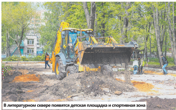
В литературном сквере появятся детская площадка и спортивная зона