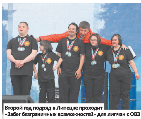
Второй год подряд в Липецке проходит «Забег безграничных возможностей» для липчан с ОВЗ