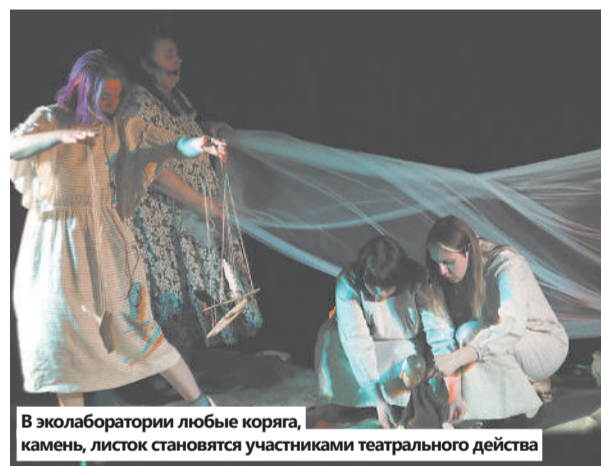
В эколаборатории любые коряга, камень, листок становятся участниками театрального действия

выкрикивали из зала ответы на вопросы и буквально штормовали его, не давая уйти со сцены.