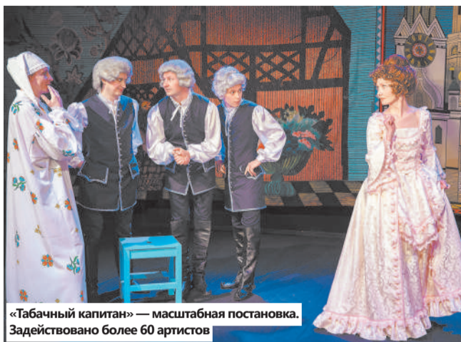
«Табачный капитан» — масштабная постановка. Задействовано более 60 артистов