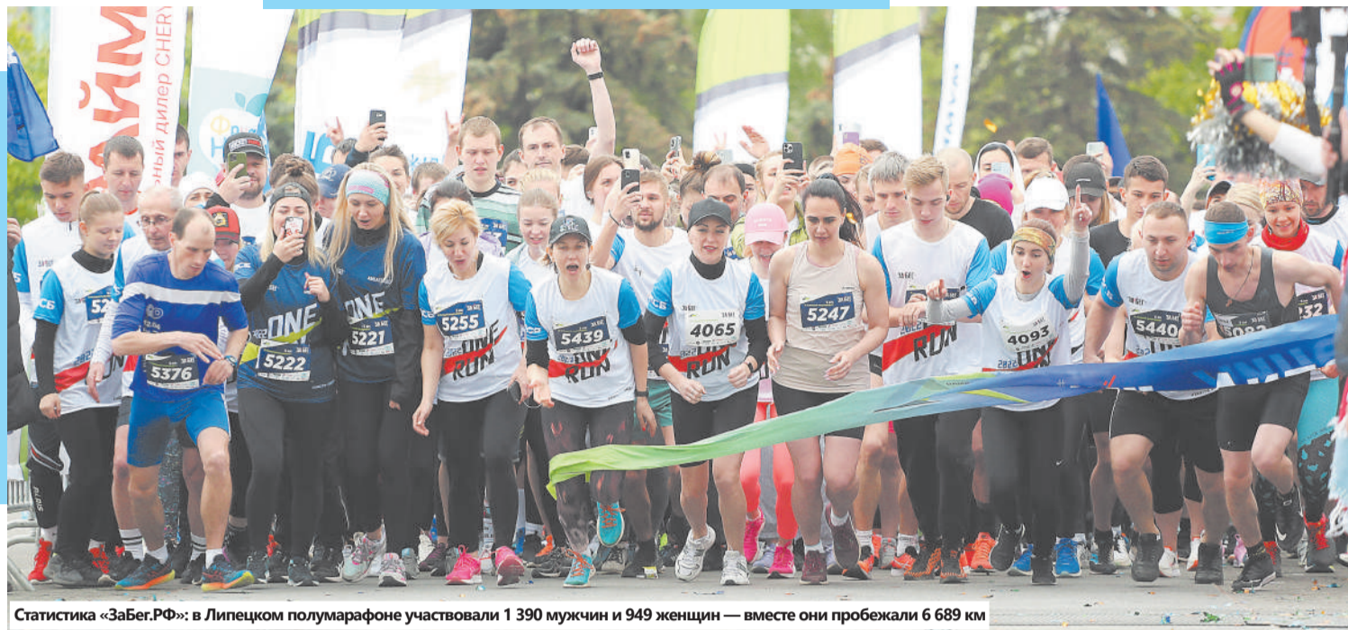
Статистика «Забег.РФ»: в Липецком полумарафоне участвовали 1 390 мужчин и 949 женщин — вместе они пробежали 6 689 км