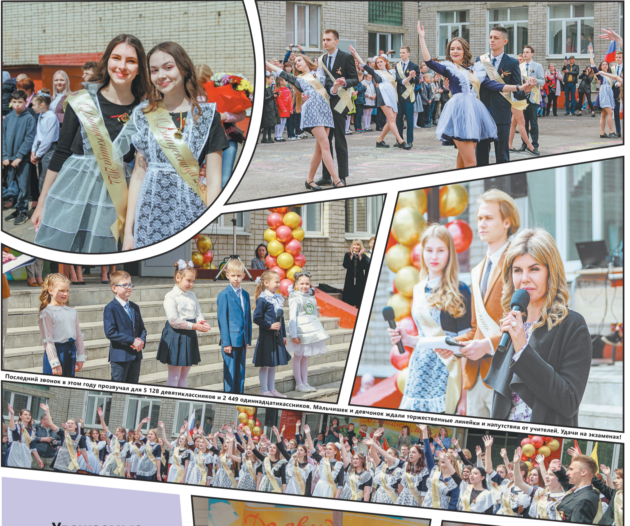
Последний звонок в этом году прозвучал для 5 128 девятиклассников и 2 449 одиннадцатиклассников. Мальчишек и девчонок ждали торжественные линейки и напутствия от учителей. Удачи на экзаменах!

Уважаемые читатели! Со следующей недели газета «Первый номер» будет выходить по вторникам. Следующий номер выйдет 31 мая.